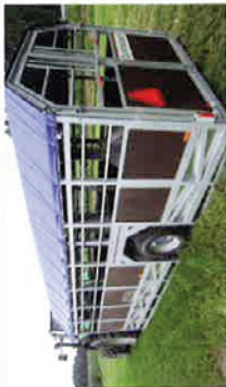
Jyfo dyrehenger for traktor. Mange modeller.