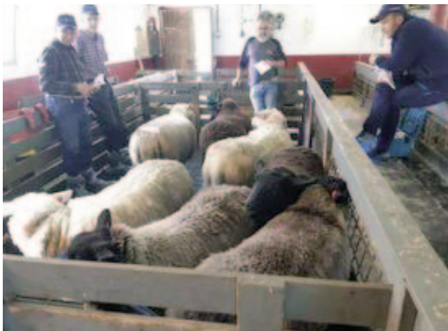
Dømming av gimrene til Tore Egil Berge