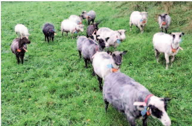
Andreas Vorland, sau med lam 2023

112 33028 (farga) Far 202041355 Mor 11045 2 pr. V 2022 (gimre med lam). 1 lam 44037 202353092 Ættp.: 6-5,5,5