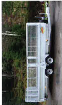
Bateson bil-, sau- og varehenger.