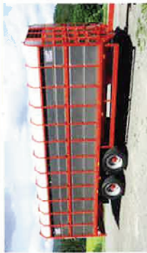
Tuff, Mac dyrehenger til traktor. Leveres fra 5,5 - 9,3 m.