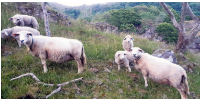
Sauer med lam, eigar Gudmund Tønnesen