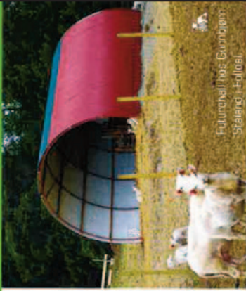
Futurehall hos Gårdsplan Strøland i Follal.

Permanente haller i 8, 10, 12, 14 og 16 m. bredde.