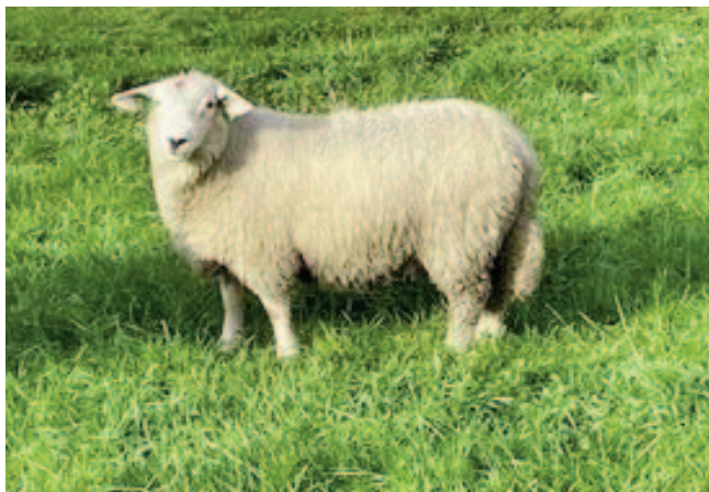
Son etter seminvêren Viking, eigar Torbjørn Nordmark