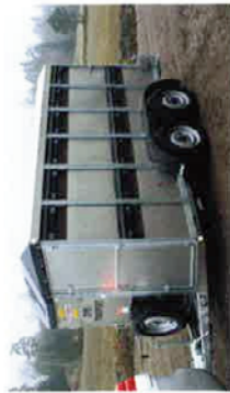
Bateson bilhenger til sau, gris, storfe og hest.